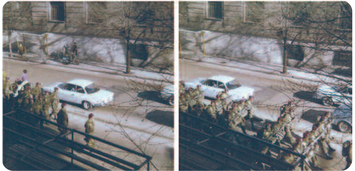
Tropas del Ejército marchan por la Avenida Colón el 24 de marzo de 1976. Las fotos fueron sacadas desde el balcón del departamento donde se reunieron algunos de los integrantes de Comisión Directiva del gremio de Perkins.